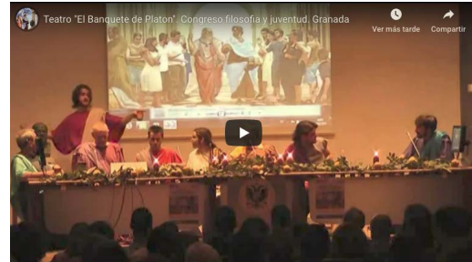
“El Banquete de Platon” a cargo del grupo de teatro “Prometeo” Congreso filosofía y juventud. Granada, 2015.