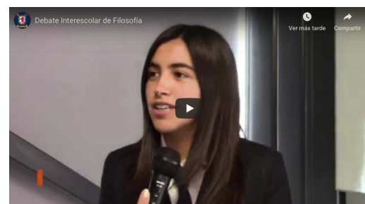
Debate Interescolar de Filosofía . Santiago de Chile.