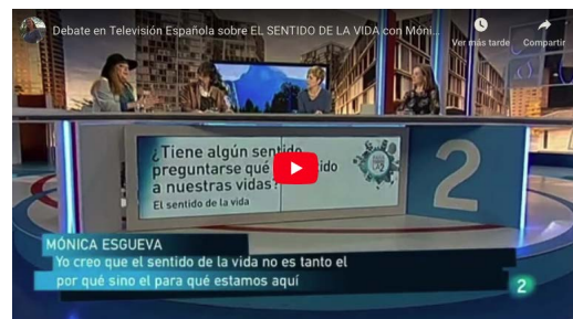
Si hay una pregunta que siga vigente desde el inicio de la humanidad es ésta: ¿Tiene sentido la vida? Coloquio en Televisión Española , programa “Para Todos La 2.