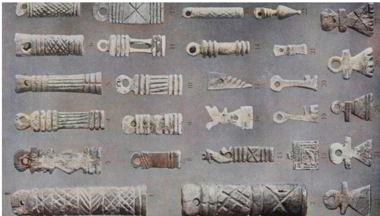
Estudio de arqueología cartaginesa: la necrópoli de Ibiza