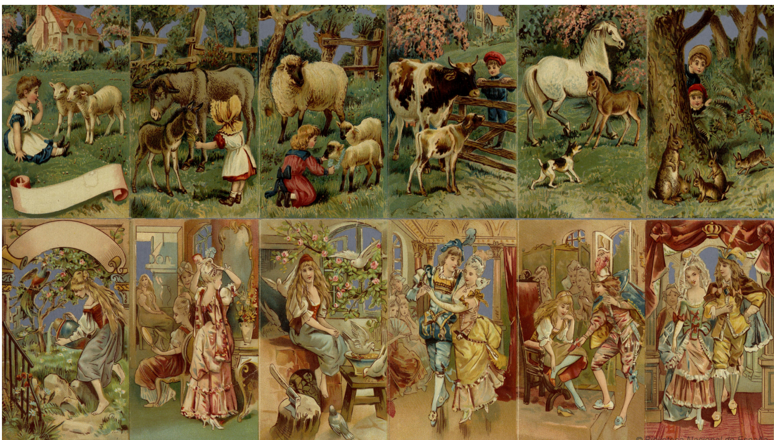
Colección de cromos de cuentos infantiles