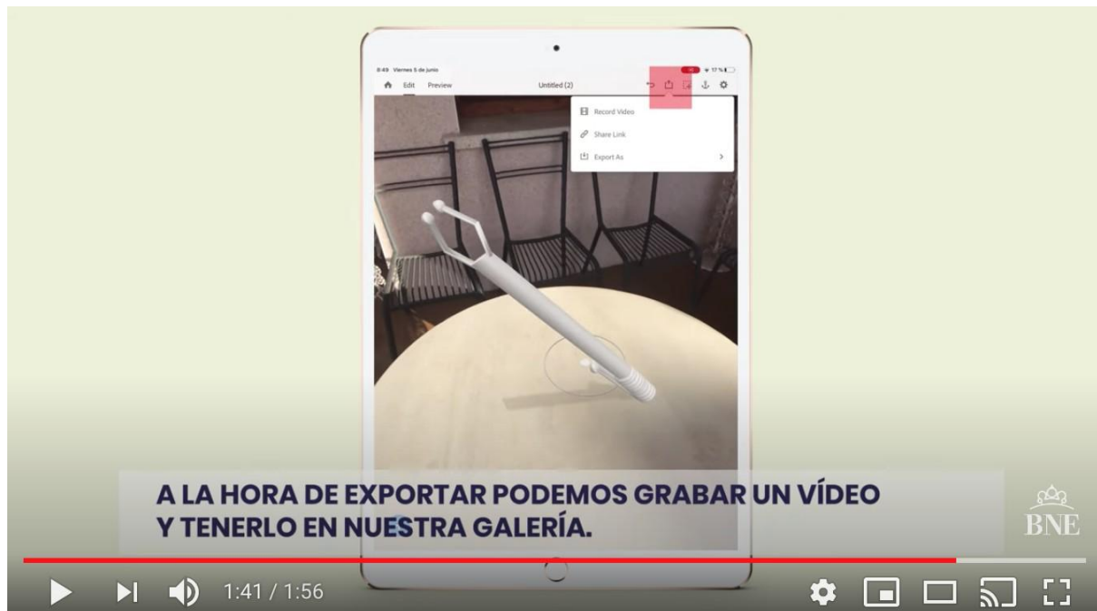
Realidad aumentada con Adobe Aero

Recordad que este proceso se tendrá que realizar para cada uno de los modelos diseñados.