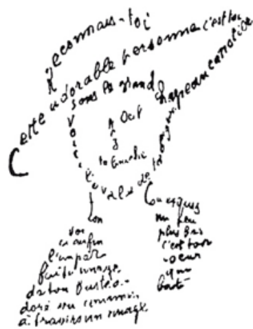
Caligrama sin títulos de Guillaume Apollinaire (1915)