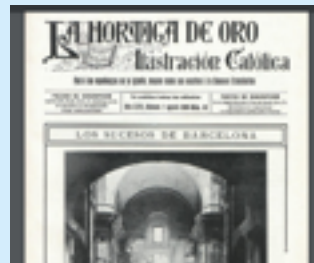
La Hormiga de Oro. Ilustración Católica