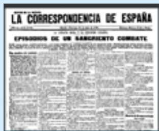
La Correspondencia de España